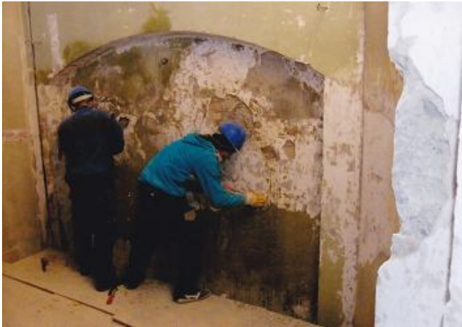
( Az enyves, olajos festés eltávolítása )

Kedves Testvérek! A templom tetőszerkezet, közel száz éves ácsozata az idők során a favédőszerek hiánya okán néhol már kézzel porlasztható állapotba került, ezért a tető fedése, cseréje megtörtént, és 2007. november 30 - ra teljesült. 2008 - ban már elkezdődött a falkutatás templomunkban. Az engedélyezési szakasz során festő restaurátor szakemberek kutatták végig a hajó és a szentély falait, boltozatát. Ennek nyomait láthattuk már 4 éven át. A kutatás célja az volt, hogy feltárjuk a templom (1751-1757) eredeti színeit, és majd az eredeti festés alapján legyenek helyreállítva a felületek.