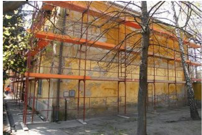
( A plébánia udvari része ilyen volt )

Ráfért már a plébániaházra is a felújítás, hisz közösségünk, városunk szégyene volt.