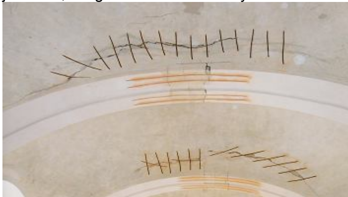
( A repedések összevarrása a hajó 1 és 2. részén)

A Képviselőtestületünk a Főnix Műszart Kft. - ét választotta a templom belső festési munkálatainak elvégzésére. A templom felújítás alatt szombaton és vasárnap is voltak szentmisék. Hétköznap reggel a szentélyben. Megtörtént a templomhajó és a szentély villanszerelése, ( a párkányokról korszerű lámpatestek világítják meg a boltozatot, melyről a fény visszaverődve betölti majd az egész templomteret). Az eredeti falikarokat szereltük vissza, sőt még egy, a mennyezetről lelógó facsillár is díszíti a templomhajó középső részét.( Régen 6 csillár volt a mennyezetre szerelve ) A templom festését egy mérszél drágább antikmész alapú festékekkel csináltattuk meg, azzal a reménységgel, hogy sokáig lesz tartós. Sajnos előzőleg, enyves, és olajfestékekkel festették le a falakat, amely nem engedte szellőzni, ezért, az összes falréteget le kellett kaparni, és újra kellett vakolni. A templomhajó és a szentély művészeti, restaurátori munkálatait, a szentély festését, az összes fa ablak felújítását, javítását, az igen tönkrement aranyozást.