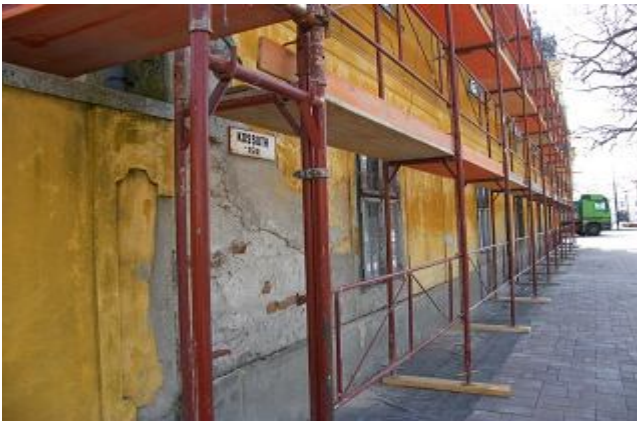
( A plébánia utcai része ilyen volt )