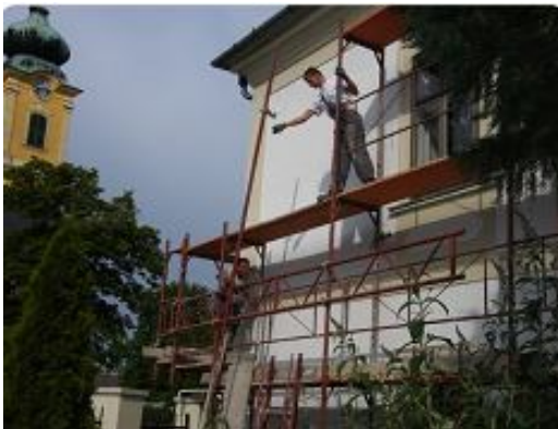
( A plébánia udvari része)