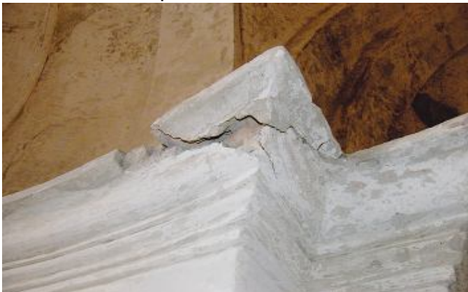
( Így néztek ki a párkányok )

A kutatás alapján egyértelműen kimutatható, hogy az eredeti festés a mostaninál egy sokkal világosabb tónusú, élénkebb színezetű volt. Ezek alapján engedélyezte a HEVES MEGYEI KORMÁNYHIVATAL EGRI JÁRÁSI! HIVATAL JÁRÁSI ÉPÍTÉSÜGYI és ÖRÖKSÉGVÉDELMI HIVATALA, templomunk festését.