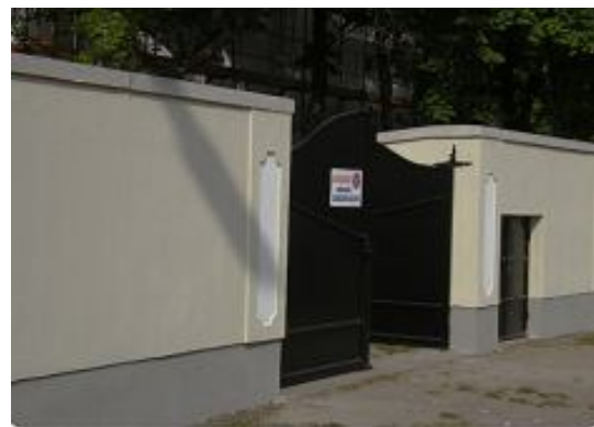
( A plébánia utcai hátsó bejárata )

Újságunk honlapunkon is olvasható! címe: http://hatvan-belvaros.hu/