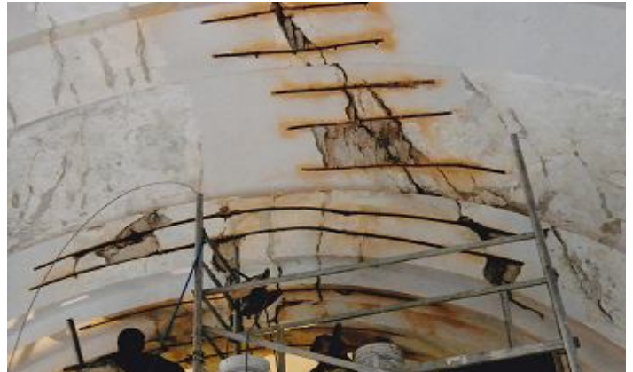
( A repedések összevarrása )