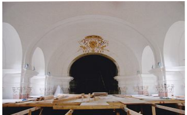
( A repedések összevarrása utáni kép )

Templomunk külső felújítását, és a járólapok lerakásához, a negyedik pályázaton: A „Hatvani Szent Adalbert Plébánia templom felújítása" tárgyú" Emberi Erőforrások Minisztériuma Pályázatán nyert támogatás: 20, 000, 000,- Ft – ot., Ehhez a Pályázathoz, saját rész is kellett, ezért a hívek által eddig adott adományokból 7.000.000 Ft – saját részzel kellett hozzájárulnunk.